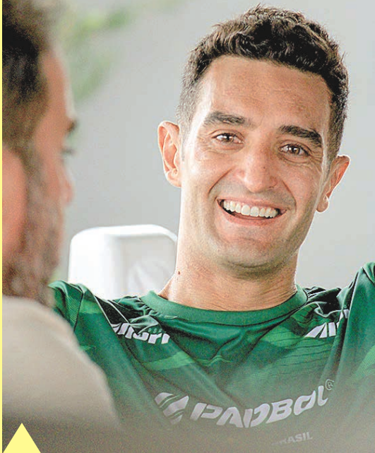
ZARAMELO JR. | O JOGO | 3 DE FEVEREIRO DE 2024