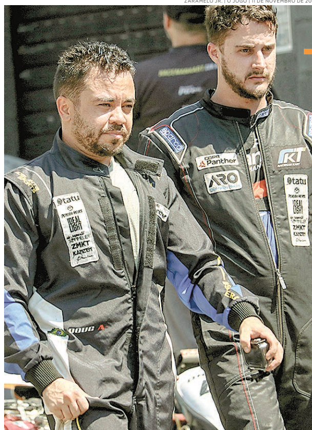
ZARAMELO JR. | O JOGO | 11 DE NOVEMBRO DE 2023

Pela segunda temporada consecutiva, o patrocínio master é da Panther Lubrificantes, com apoio geral da Aro Contabilidade. A Copa Raceman também tem patrocínio de Leofran Transportes, Ideal Light, Pereira Neves Motors, Seritec, Centro Norte Distribuidora, Tatu Shopping Frutas, Agência ZMKT e TechZ Informática.