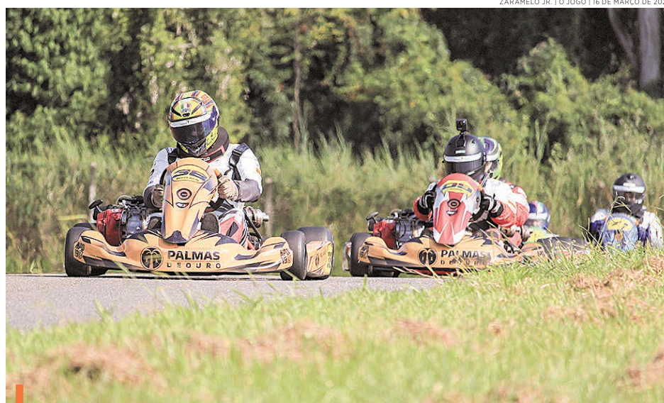
Depois de Limeira, pilotos agora se preparam para etapa em Interlagos