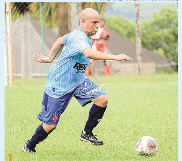
O ala fluuante Rean vai a campo neste sábado

Na quinta-feira, também no período noturno, haverá a