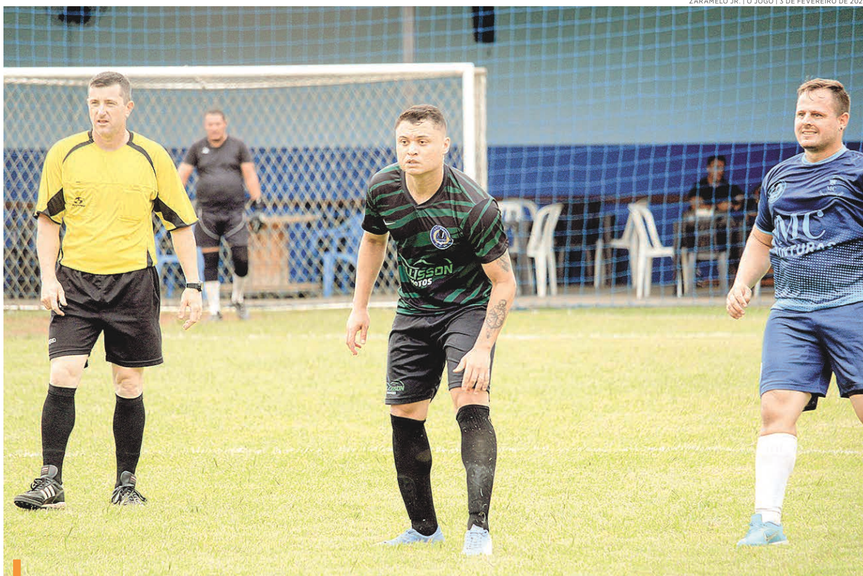
ZARAMELO JR. | O JOGO | 3 DE FEVEREIRO DE 2024

14h10 Barbearia Monterrey x Supermercados Pérrola 15h JRT Hobbies x Optilar Óptica 15h MC Pinturas x LuksCar 15h20 Z Sport x Pellisson Motos