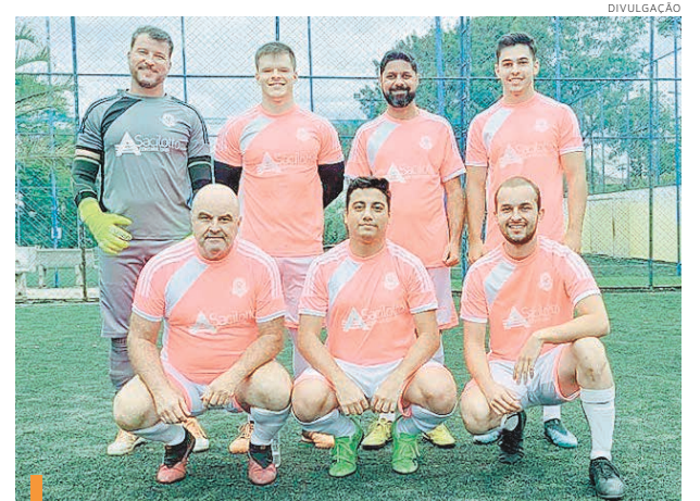
Sacilotto Contabilidade aparece em segundo lugar