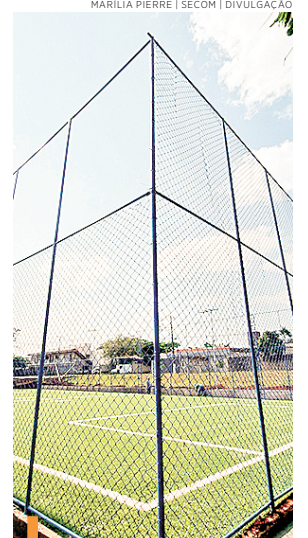
Entrega do campo ocorre em breve

A construção do espaço foi intermediada pelo vereador Léo da Padaria, através