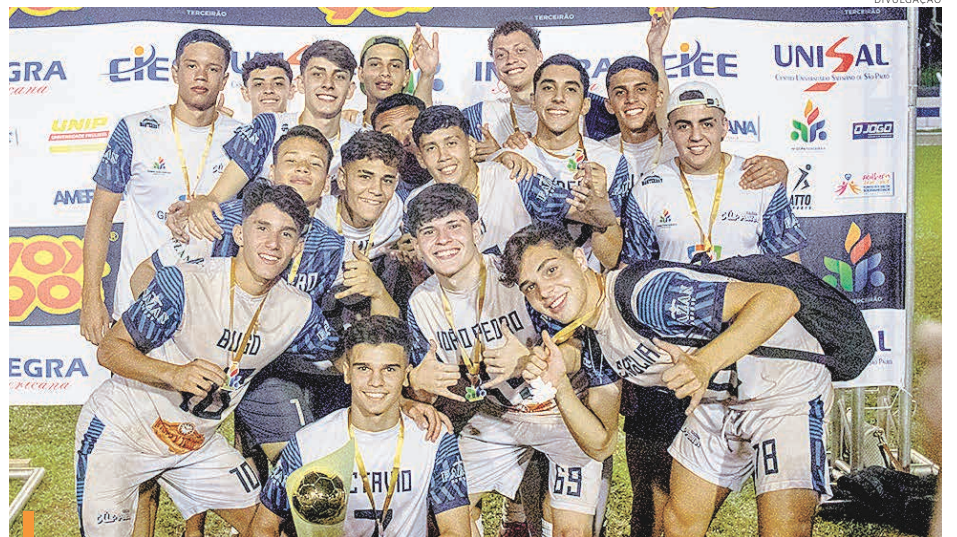
Colégio Politec conquistou o título do futebol da 10ª edição