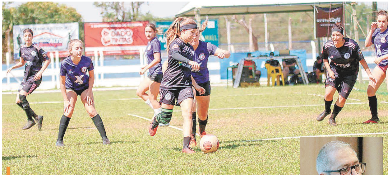
Copa Terceirão teve disputa bastante intensa entre as equipes do futebol feminino

esperamos ter atendido as expectativas de quem veio participar das competições, quem veio visitar, quem veio assistir. Procuramos fazer tudo de melhor dentro do que tínhamos disponível." O CEO finalizou citando que "contamos com o apoio enorme de todas as instituições de ensino, tivemos