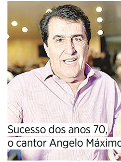
Sucesso dos anos 70, o cantor Angelo Máximo