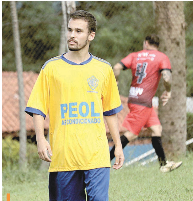
Renato Gabriel é arma do Peol Ar no jogo contra líder

A quarta rodada acontece neste sábado (11) com quatro jogos: Andrade Contábil x Trevilub e Della Vita x Peol Ar, às 15 horas; TS Construções x MB