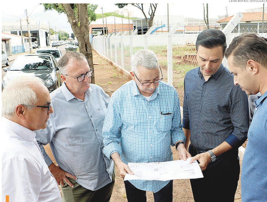
Autoridades foram vistoriar o local do novo núcleo de judô

Novo núcleo da modalidade deve atender em torno de 200 atletas