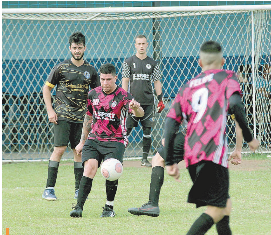
Z Sport, do meia Biri, ganhou na ida e agora joga pelo empate

Rodada de sábado aponta quem vai à decisão do título