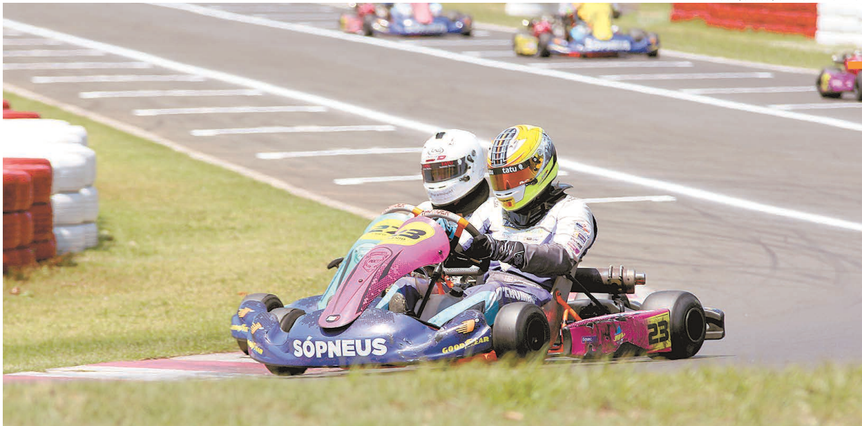
ZARAMELO JR. | O JOGO | 19 DE NOVEMBRO DE 2022

Piloto #23 ganhou as duas provas no encerramento da temporada