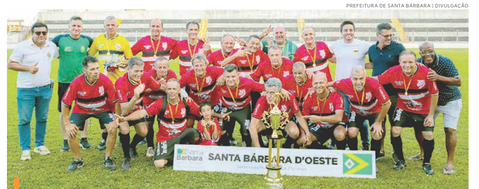
O Carioba sagrou-se campeão do Campeonato Mega Master em Santa Bárbara