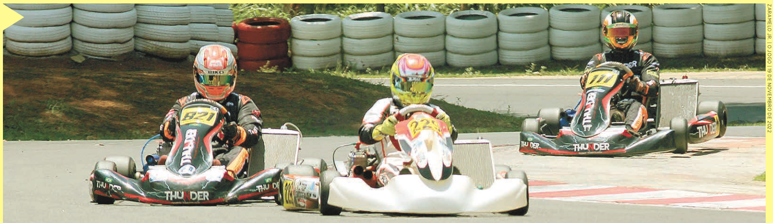
O JOGO | 19 DE NOVEMBRO DE 2022